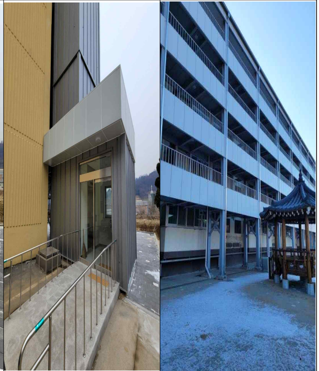
엘리베이터 및 연결복도