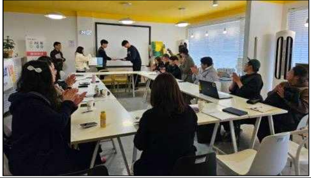
○ 흥성통 정기회의(2월, 재생통 활동 공유)