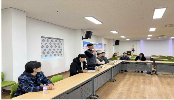
○ 흥성통 회의 사진