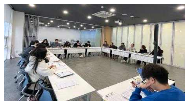
○ 흥성통 관광통(2월, DMO사업 협의)