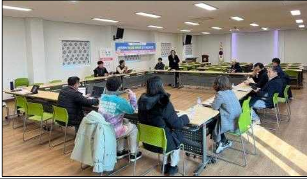
○ 흥성통 정기회의(1월, 금년 추진계획 공유)