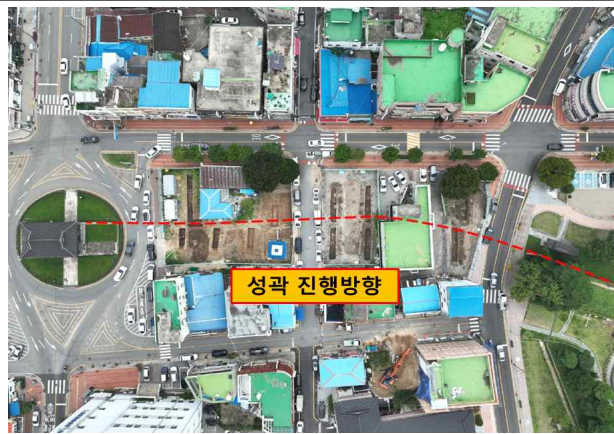
동남측 성곽 발굴조사 착수