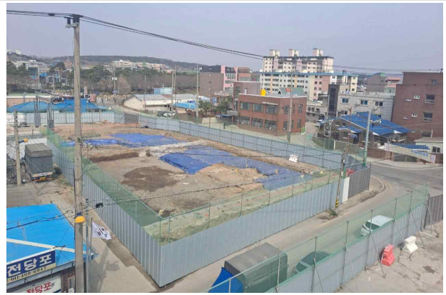
북동측 성곽 발굴조사 완료