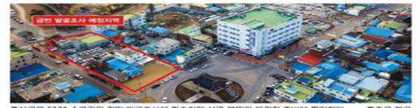
홍성군은 2770㎡ 구간의 정밀 발굴조사에 착수하여 성곽 복원의 본격적 준비에 돌입했다.