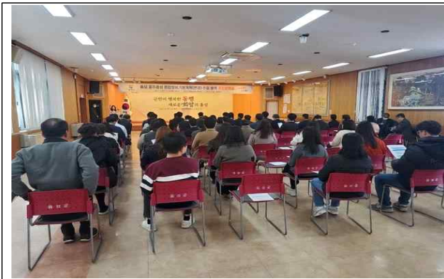
종합정비기본계획 (변경) 수립 주민설명회