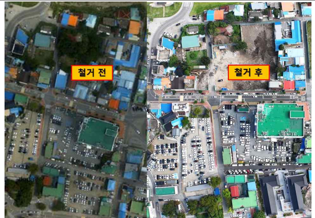
객사 복원정비사업 대상지 철거(1차)