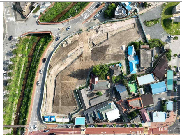
북서측 성곽 발굴조사 완료