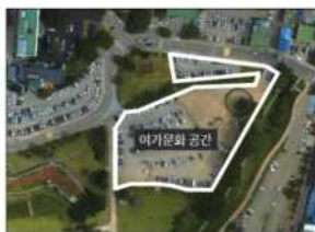
홍성군은 장기간 임시주차장으로 사용해 온 홍주읍성 내 홍주역사관 인근 공터에 11월까지 여가문화 공간을 조성한다. 사진은 여가문화 공간 조성부지 모습.

14일 홍성군에 따르면 장기간 임시주차장으로 사용해 온 홍주읍성 내 홍주역사관 인근(오관리 108번지 일원 등) 공터 8461㎡(2560평)에 사업비 5억 9800만 원을 들여 여가문화 공간을 조성한다.