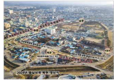
홍주읍성 성곽 발굴 예정지 모습.