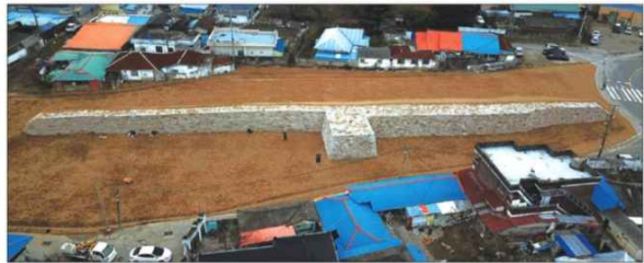
최근 복원이 완료된 홍주읍성 북문 동측 성벽

을 목표로 본격 진행을 예고한 만큼 오랫동안 군민의 숙원이었던 북문지 주변 성곽에 대한 복원·정비가 가시적인 성과를 내고 있다. 또한 2024년에는 북동측 성곽(북문 동측성벽 완료지점부터 조양문 북측 구간) 정비공사가 2025년도까지 진행될 예정이며, 이 공사가 끝나면 북문지에서 조양문까지 이르는 멸실 성곽은 복원·정비가 마무리된다. 이와 함께 멸실된 성곽 복원·정비의 학술자료 및 실시설계 기초자료 획득을 위한 발굴조사도 박차를 가해 서문지(舊 정보 화교육장)부터 북문지 구간은