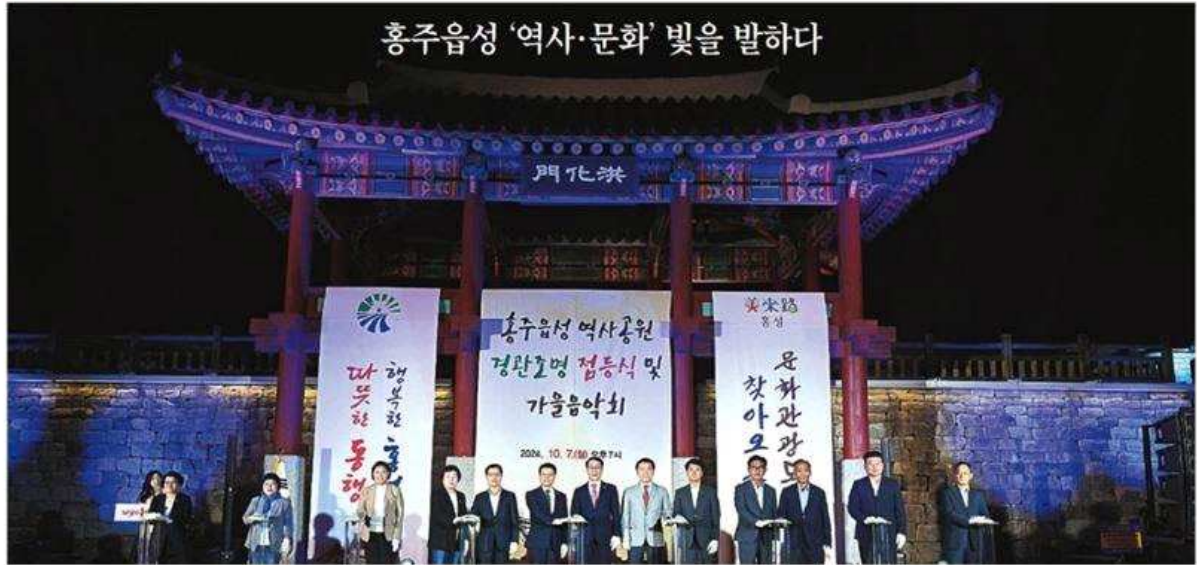
홍성군이 지난 7일 홍주읍성 남문 광장에서 '홍주읍성 역사공원 경관조명 점등식을 열고 있다.