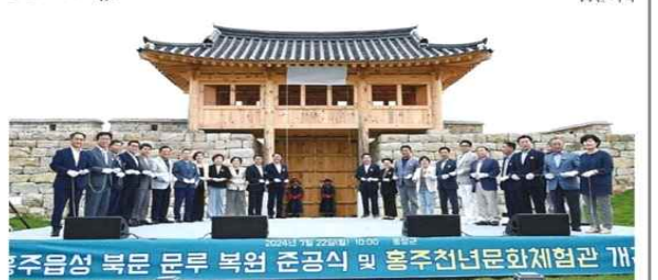
홍주읍성 북문 문루 복원 준공식 및 홍주천년문화제협관 개