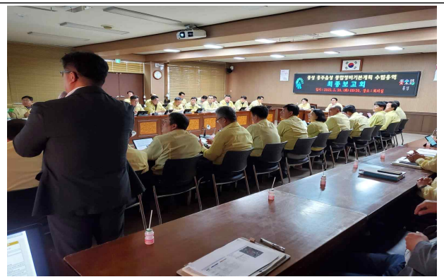
종합정비기본계획 (변경) 수립 최종보고회