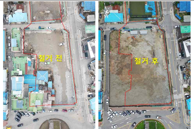
조양문 주변 정비 대상지 매입 및 철거 완료