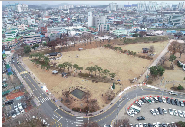
여가문화공간 조성 준공