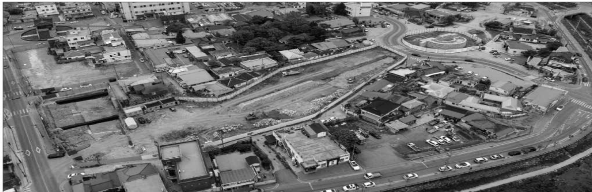
파괴된 성곽 복원 시작을 위한 북측 동측성벽 복원 정비 작업이 지난 3월 공사중지 해제가 됐다. 사진은 홍성 홍주읍성 북문 동측 성벽 정비 현장.

홍성/김원중 기자 wjkim37@dailycc.net 18.5 X 14.8 cm