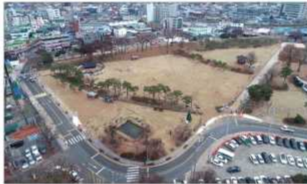
임시 주차장으로 사용돼 오던 홍성 홍주읍성 내 유휴 공간이 여기문화 공간으로 탈바꿈해 12월부터 지역민에 개방된다. 조성 사업을 완료한 홍주읍성 여기문화 공간 모습.

군은 이 일대에 축제 및 행사·교유체험 등 다목적 활용이 가능한 잔디광장을 조성하고 주변에 소나무 식재와 벤치 및 피코라 등 휴식시설을 설치하는