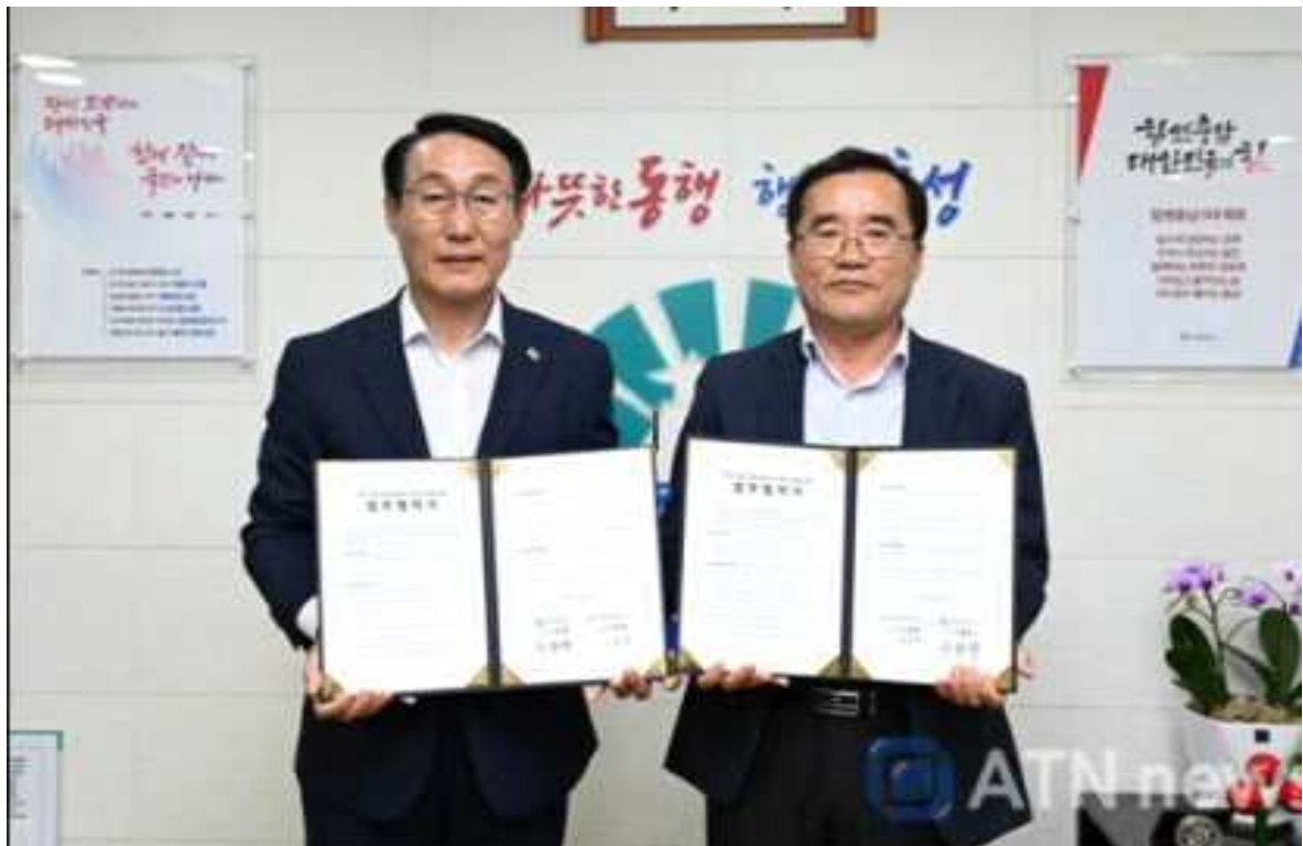
홍성군&충남드론항공고 MOU 체결