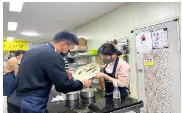
미혼남녀 대상 프로그램