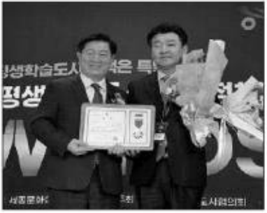
좋은 정책상 수상 기념촬영 모습.

홍성군은 지난 18일 서울 세종문화회관에서 열린 '2022년 제1회 대한민국 평생학습도시 좋은 정책 어워드'에서 '좋은 정책상'을 수상했다.