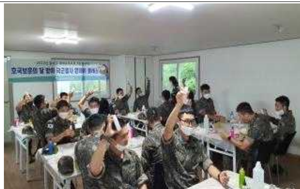
원데이 클래스(군인 대상)