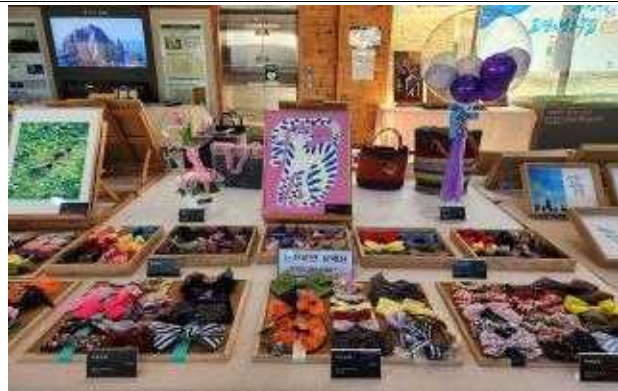
수강생 작품 전시회