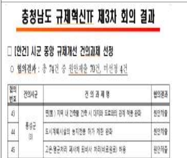
중양부처 규제혁신 건의과제 선정(원안제출)