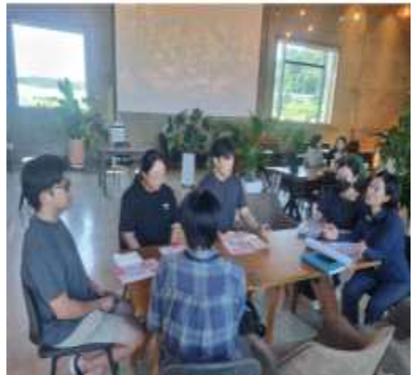
찾아가는 지방규제 신고센터 운영