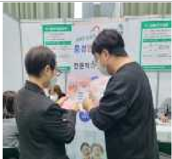
찾아가는 지방규제 신고센터 홍보