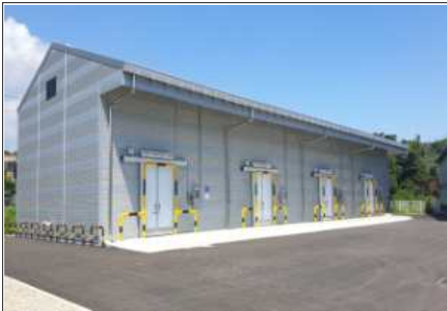
원초보관 냉동창고 지원사업 준공 현장