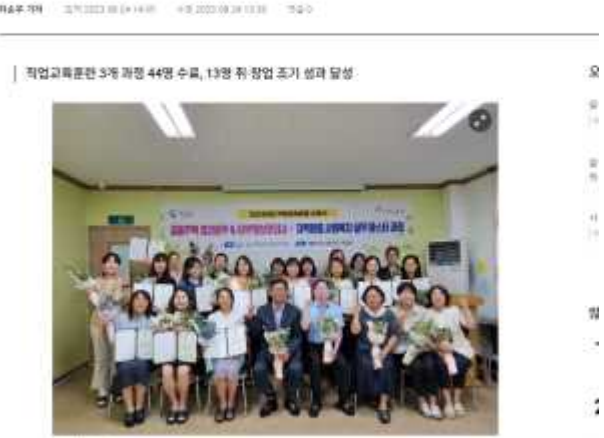
충남 홍성여성새로일하기센터, 직업교육훈련 수료식 개최