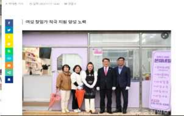
홍성군, 내 희망상가 여성 성공창업 공간 현판식 진행