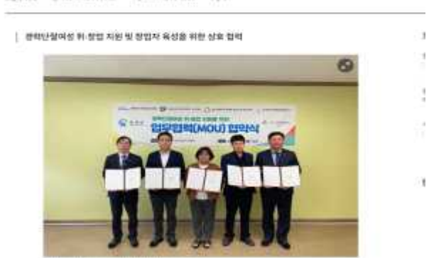
충남 홍성새일센터, 충남사회복지사협회 등 4개 기관과 MOU 협