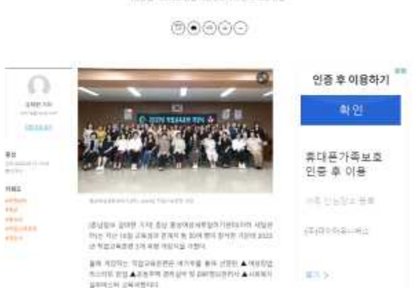
홍성여성새로일하기센터, 2023년 직업교육훈련 개강