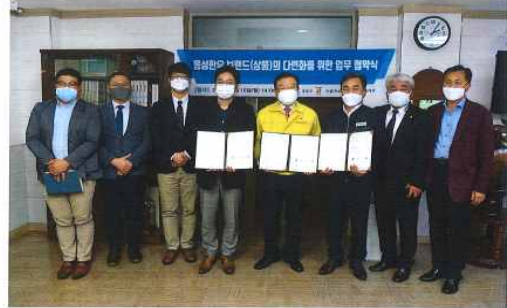
지난 10일 홍성한우 상품 다양화 및 홍성한우의 부가가치 향상을 위해 축산물 가공품 개발·판매 업무 협약식을 체결했다.

[중부매일 황진현 기자] 홍성군이 홍성한우 가공품 개발 및 확대를 위해 관내 기업과 손을 맞잡고 신규 판로개척과 농가소득 창출이라는 두 마리 토끼 잡기에 나선다.