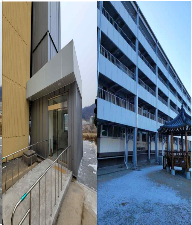
엘리베이터 및 연결복도