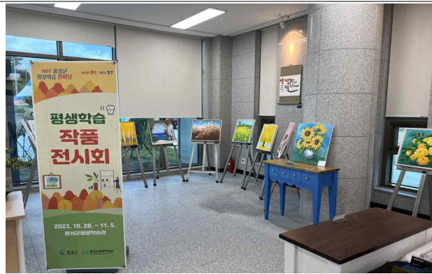
수강생 작품 전시회