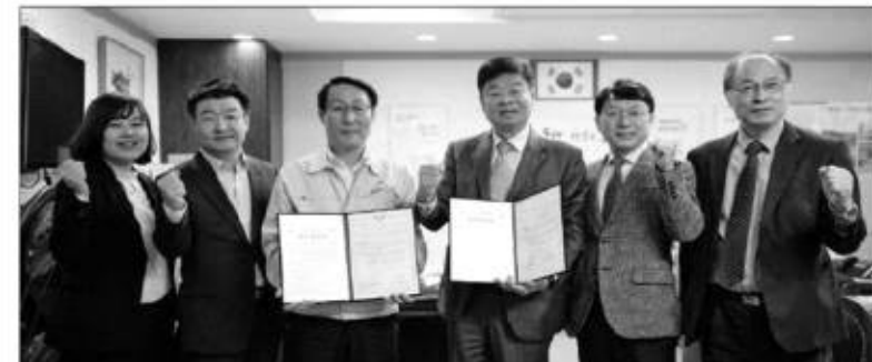
평생교육 진흥 위한 업무협약식 기념촬영 모습.

홍성군은 지난 25일 청운대학교와 평생교육 진흥을 위한 업무협약을 체결했다.