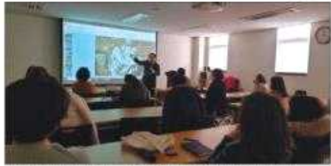
내포신도시 평생학습센터에서신원미 주민비율로 운영되는 평생교육 프로그램 진행 중.

신도시평생학습센터에서는 인문교양분야 8개 프로그램 140명이 참여했다. 지난 6일부터 프로그램을 진행 중이다. 신도시학습센터는 내포신도시 총합을 주민복합지원센터 건물을 함께 쓰고 있다. 신도시 센터의 경우는 수강생이 많아 평양이나 온라인으로 신청할 후 모집인원을 초과한 프로그램은 전산추첨을 통해 대상자를 선정했다. 두 곳 모두 1인 최대 20명까지 수강할 수 있는데, 대부분의 프로그램에서 수강료는 무료, 재료비나 교재비는 지부담하는 것으로 운영된다. 신도시 학습센터는 또 문화예술분야 6개 프로그램과 4개 6명 규모의 직업능