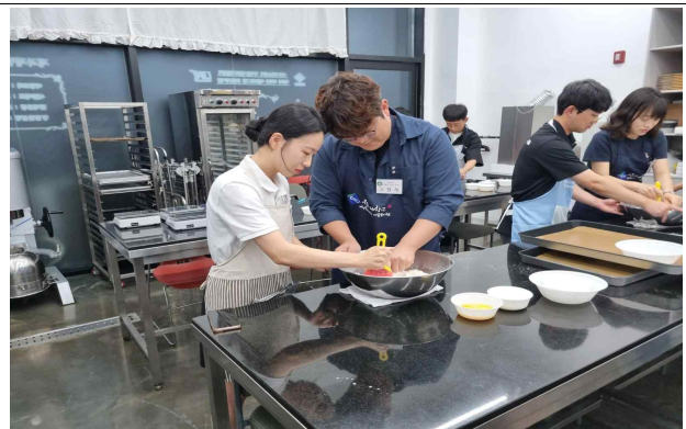
미혼남녀 대상 프로그램