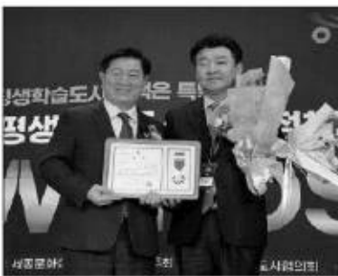
좋은 정책상 수상 기념촬영 모습.

홍성군은 지난 18일 서울 세종문화회관에서 열린 '2022년 제1회 대한민국 평생학습도시 좋은 정책 어워드'에서 '좋은 정책상'을 수상했다.