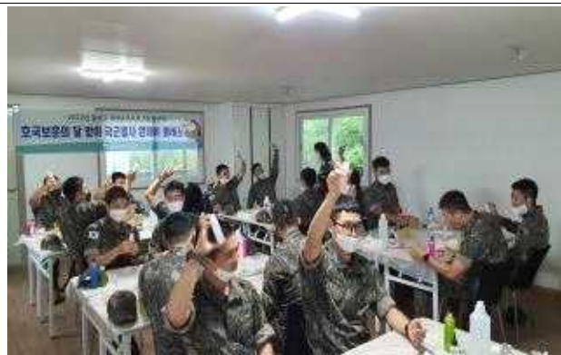
원데이 클래스(군인 대상)