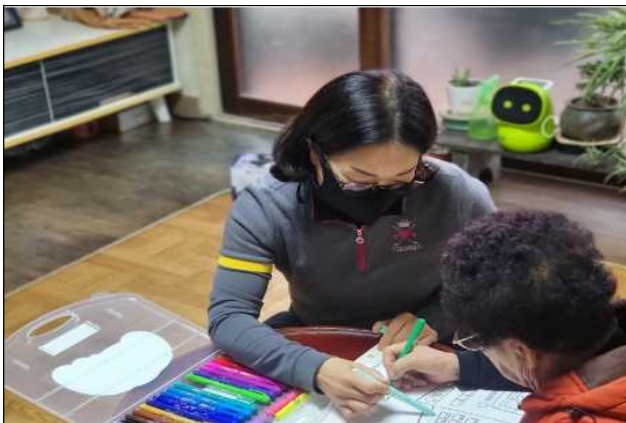
노인맞춤돌봄서비스 대상자 인지활동 사진