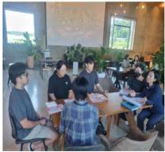
찾아가는 지방규제 신고센터 운영