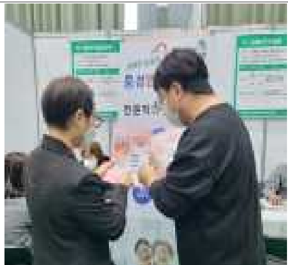
찾아가는 지방규제 신고센터 홍보