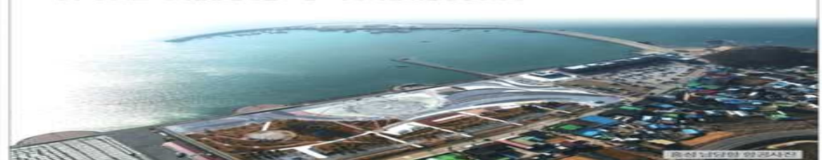
홍성 남당항 항공촬영