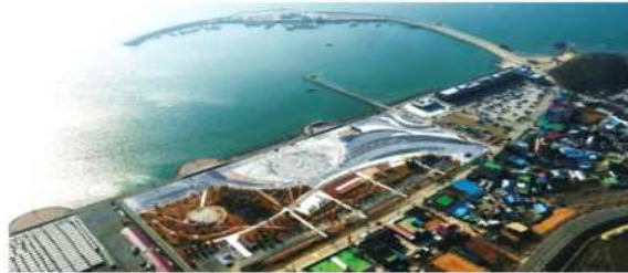
홍성군 대표 관광지 남당항 항공촬영

남당항은 뛰어난 먹거리에 비해 볼거리와 즐길 거리 등 관광인프라가 부족해 높은 인지도에 비해 관광객의 체류시간이 짧고, 해산물 먹거리 중심의 관광지 특성상