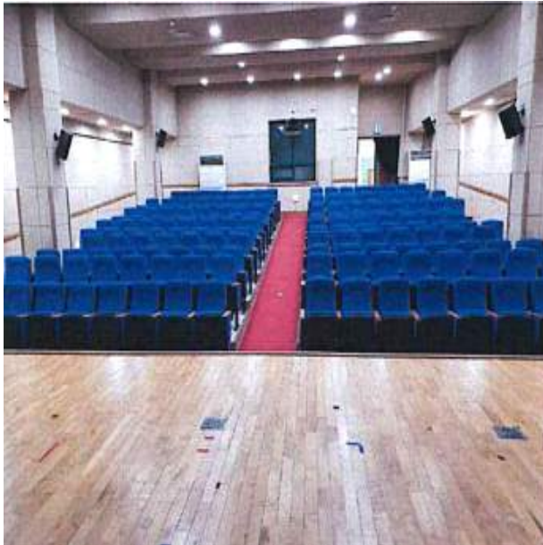
리모델링 (전) 청소년수련관 예술전당