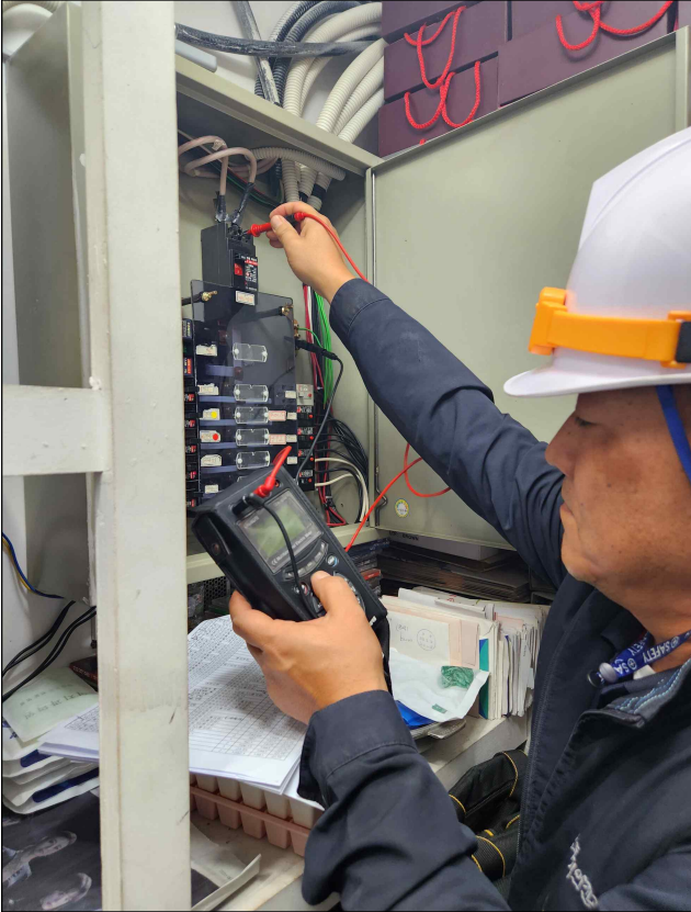
접지 저항 측정