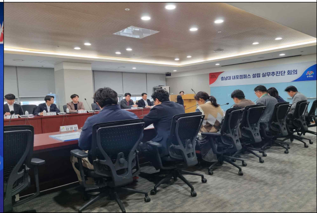
강승규 당선인 공약(일부)