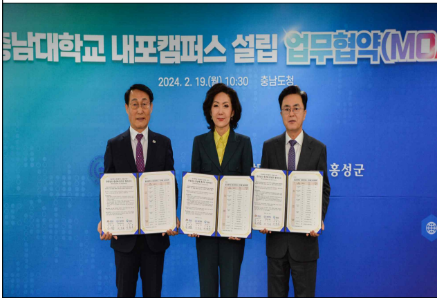
충남대학교 내포캠퍼스 설립 업무협약